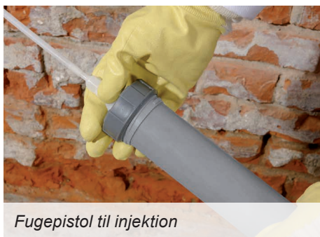
Fugepistol til injektion