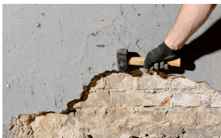
Gammel puds fjernes