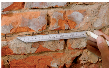
Udmåling af huller til injektion med interval på 8 cm