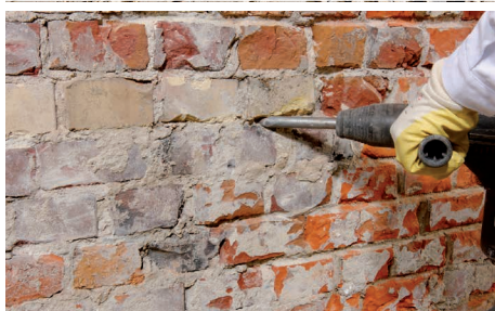
Boring af huller til injektion med 12 mm-bor